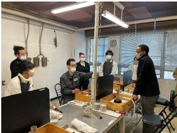
12/13留学生ものづくり講座ガラス工作